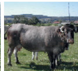
ÉLEVAGE BOVIN BAZADAISE ET OVIN