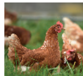
CULTURE FOURRAGE ET VOLAILLE