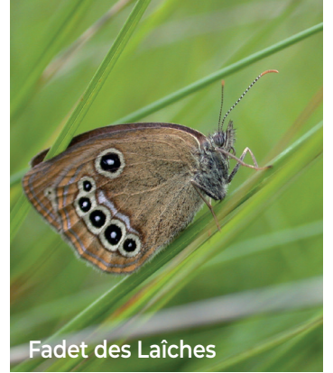
Fadet des Laïches

La démarche ERC (éviter, réduire, compenser) que nous appliquons sur chacun de nos projets, nous a permis de délimiter une zone plus de 100 ha à préserver. Nous pouvons désormais définir les implantations les plus adaptées pour les centrales solaires. Elles vous seront présentées prochainement.