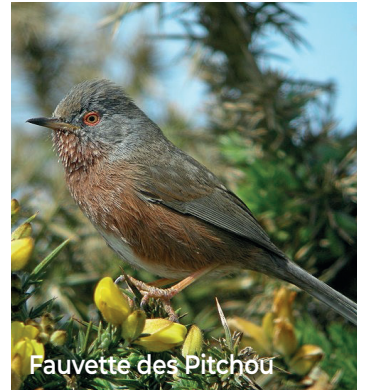
Fauvette des Pitchou