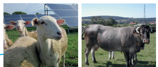
ÉLEVAGE : BOVIN BAZADAISE ET OVIN