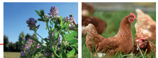
CULTURE DE FOURRAGE ET VOLAILLE