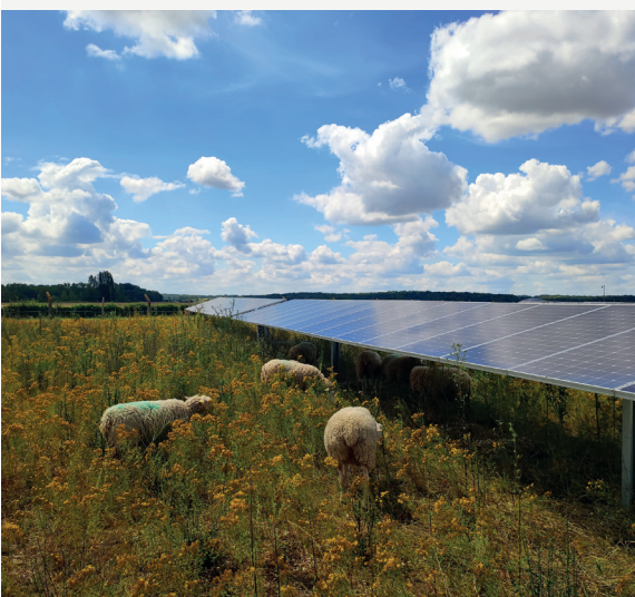
Une réalisation agrivoltaïque de VALOREM dans l'Aube, le parc de Lassicourt, avec l'installation d'un pâturage ovin.

L'installation d'un parc solaire a pour objectif de produire de l'électricité . En fonction des équipements mis en place, la production sera plus ou moins importante .